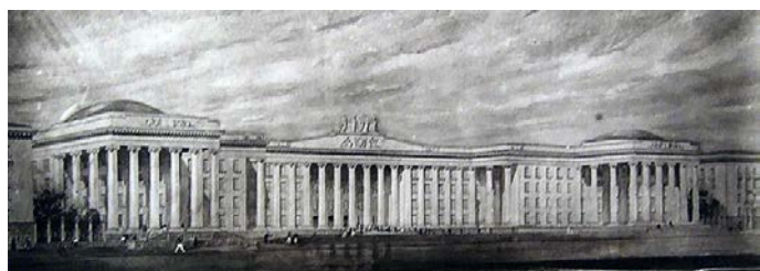
Педагогический институт по пр. им. Ленина. 1952 г. Проект (вверху), общий вид (справа и внизу). Архит. В. Масляев, Г. Борисенко

Родился в с. Паньшино Ульяновской обл. В 1936 г. окончил Московский архитектурный институт, архитектор, в 1942 г. – Военно-инженерную академию им. В. В. Куйбышева, военный инженер. В 1935 г. работал архитек-