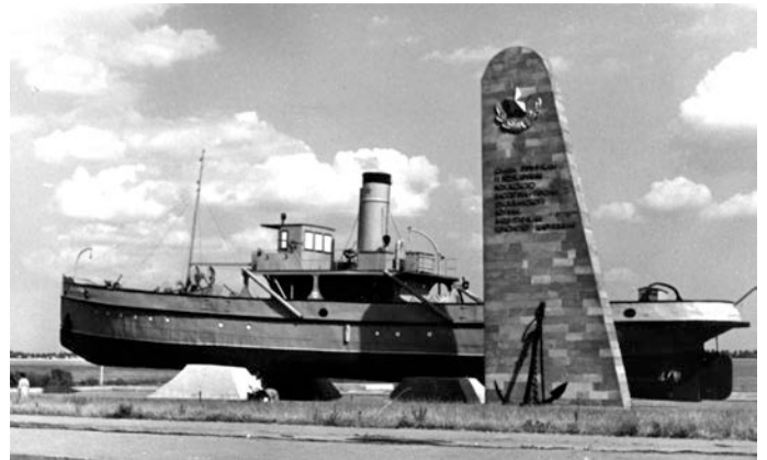
Памятник речникам Волжского бассейна, героям гражданской войны 1918-1920 гг. и Сталинградской битвы 1942-1943 гг. 1976 г.