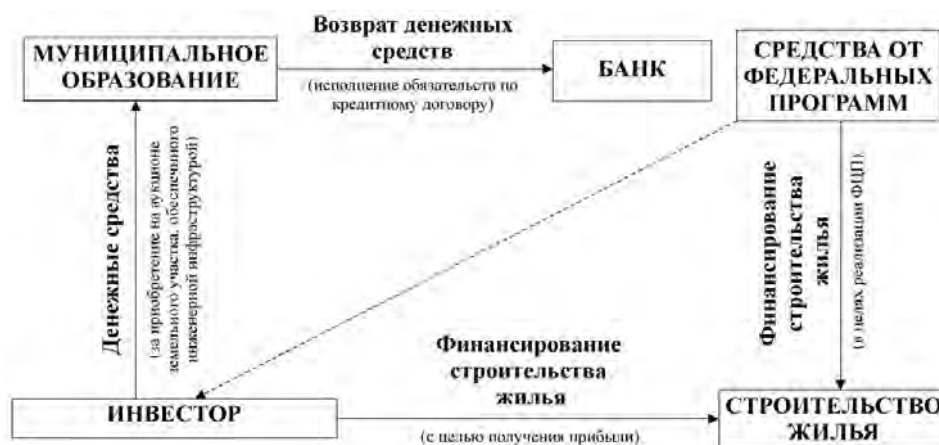
Рис. 2. Возврат кредита банку после строительства инженерной инфраструктуры

Процедура и последовательность управленческих решений для реализации технологии участия муниципальных органов в реализации программ массового жилищного строительства: