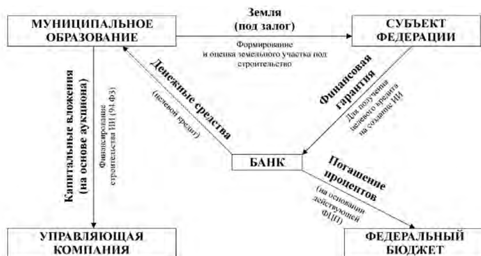
Рис. 1. Получение кредита на создание инженерной инфраструктуры под гарантию регионального бюджета