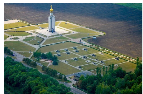
Рис. 2. Военно-исторический музей-заповедник «Прохоровское поле», посвященный крупнейшему танковому сражению в Великой Отечественной войне, Белгородская область