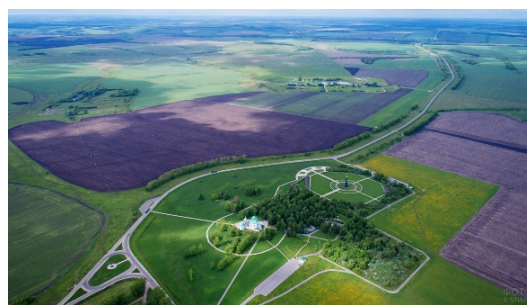
Рис. 1. Музей-заповедник «Куликово поле» — российский музейный комплекс, посвященный Куликовской битве, Тульская область, общий вид

В России имеется большое число пространственно-территориальных памятников Великой Отечественной войны, которые уже отнесены к достопримечательным местам (ДМ) или ждут изменения статуса своей территории и корректировку режимов ее использования в соответствии с действующим законодательством в сфере охраны объектов культурного наследия. В нашей стране на территории трех полей исторических сражений («полей сражений» или «ратных полей») созданы музеи-заповедники: на Куликовом поле (Тульская область, ДМ федерального значения, рис. 1), Бородинском поле (Московская область, ДМ федерального значения) и Прохоровском поле (Белгородская область, ДМ федерального значения, рис. 2). Территория Волгоградской области и г. Волгограда выделяется концентрированностью памятников и памятных мест, относящихся к событиям Великой Отечественной войны и, в первую очередь, Сталинградской битвы.