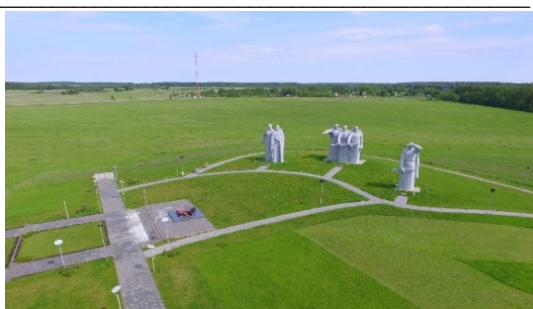
Рис. 8. Мемориал «Героям-панфиловцам», Московская область

Следующая ситуация — «поле сражения» охватывает несколько поселений, городов, населенных пунктов. Такие военно-исторические ландшафты занимают огромную площадь. Например, «Бородинский военно-исторический музей-заповедник» (рис. 9) площадью 110 км 2 , в котором зона историко-культурного ландшафта представляет собой территорию, сложившуюся в границах панорамного визуального восприятия исторического ядра ДМ, в районе дд. Бородино, Семеновской, Шевардино, Горки, Валуево 1 .