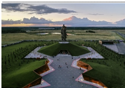
Рис. 7. Ржевский мемориал Советскому солдату, Тверская область