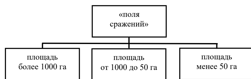
Рис. 3. Классификация ВИЛ по площади территории

Благодаря этому можно в дальнейшем при планировании таких территорий рационально распределить функциональные зоны (рис. 3).