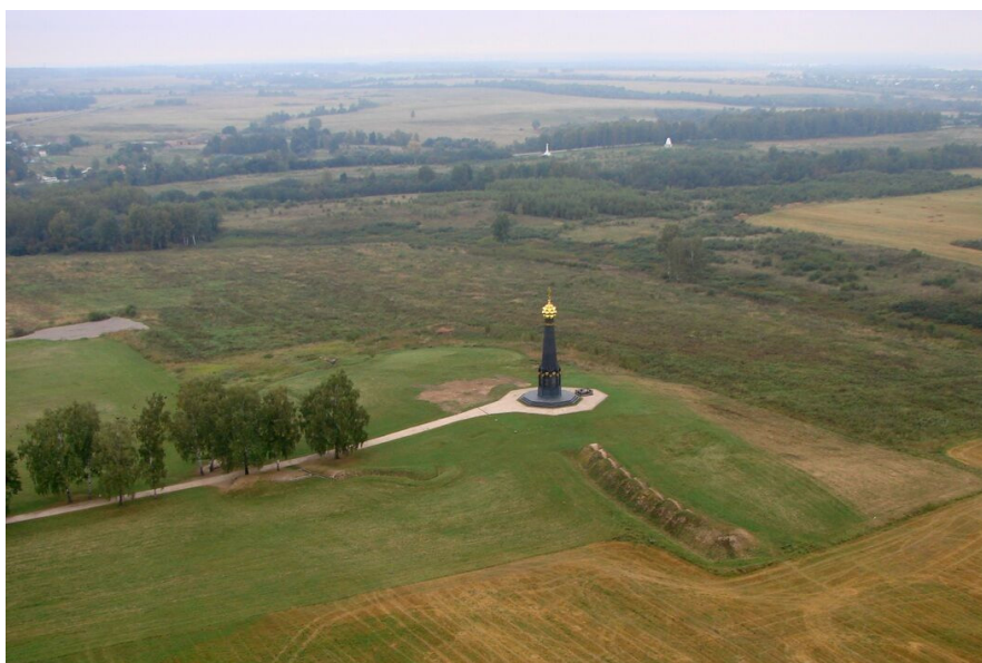
Рис. 9. Музей-заповедник «Бородинское поле» — мемориал двух Отечественных войн, старейший в мире музей из созданных на полях сражений; Московская область, общий вид

Следующая ситуация — «поле сражения» охватывает несколько поселений, городов, населенных пунктов. Такие военно-исторические ландшафты занимают огромную площадь. Например, «Бородинский военно-исторический музей-заповедник» (рис. 9) площадью 110 км 2 , в котором зона историко-культурного ландшафта представляет собой территорию, сложившуюся в границах панорамного визуального восприятия исторического ядра ДМ, в районе дд. Бородино, Семеновской, Шевардино, Горки, Валуево 1 .