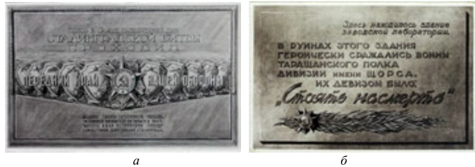
Рис. 7. Памятные доски архитектора-художника Федора Андреева. Художественный фонд СССР. Производственное управление скульптурно-художественными предприятиями. Мытищинский завод художественного литья: а — доска, посвященная зданию заводской лаборатории; б — доска, посвященная Сталинградской битве

В художественном фонде СССР до сих пор хранятся мемориальные доски Ф. Андреева, которые демонстрируют авторскую композицию поля доски: барельеф и различные сочетания шрифтов, которые удачно характеризуют этот период, а именно звезда красной армии, лавровые ветви, щит и оружие (рис. 7).