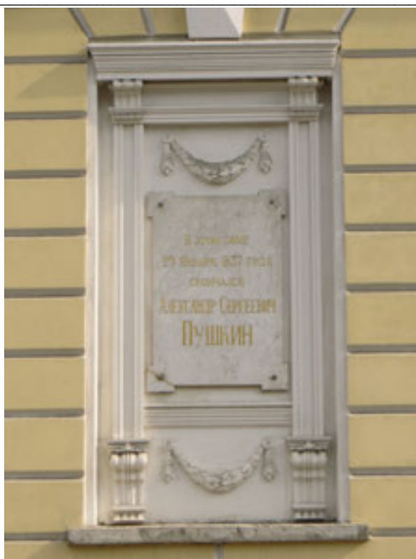
Рис. 4. Мемориальная доска А. С. Пушкину, установленная в 1880 г. по проекту архитектора Н. Л. Бенуа (самая первая мемориальная доска Санкт-Петербурга)

Временной период до Октябрьской революции 1917 г. в России можно охарактеризовать как застойный с точки зрения количественного подхода в установке памятных досок в том виде, в котором они представляются сегодня.