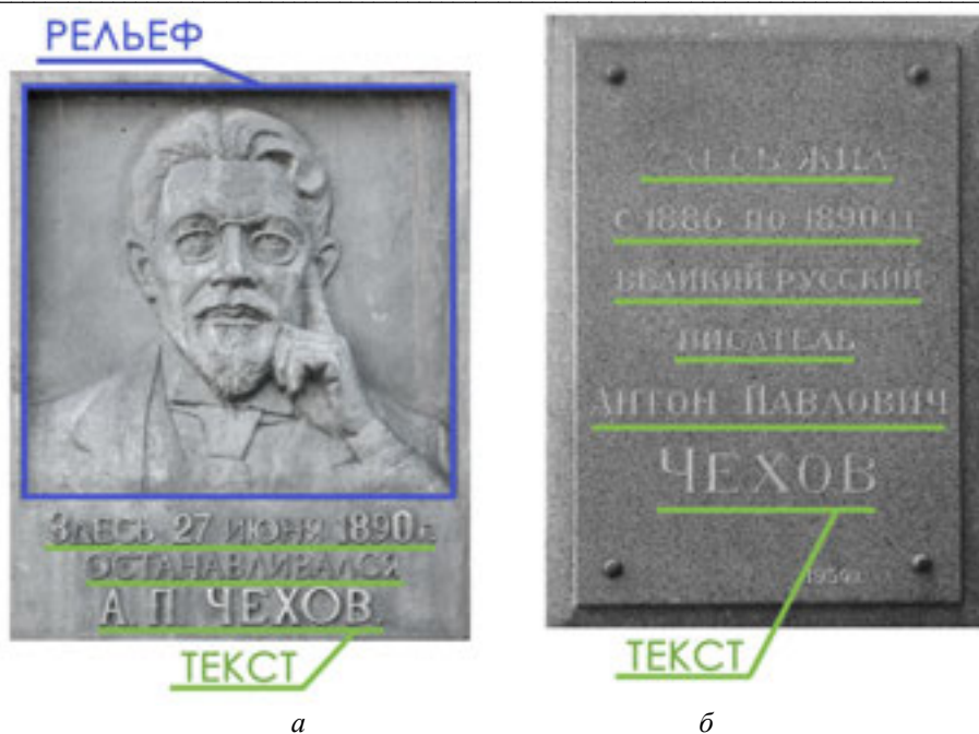
Рис. 5. Типы мемориальных досок: а — скульптурное или рельефное художественное изображение в сочетании с информативной надписью; б — без скульптурного изображения, с содержательной надписью

Значительную роль в архитектурно-художественном облике городской среды играли мемориальные доски, создаваемые в России в рамках политико-массового искусства последних 50 лет XX века. Композиционно-образные решения мемориальных досок во многом определялись общими мировоззренческими установками. Для советского времени характерна насыщенная идеологизированность и патриотичность, что ярко отобразилось в текстовом наполнении досок. Принципы искусства XX века — воспроизведение современной действительности, идеалов, общественных отношений.