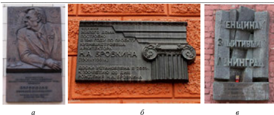
Рис. 8. Мемориальные доски: а — доска математику Н. Н. Боголюбову, бронза, 2010 г.; б — доска архитектору Н. А. Бровкину, бронза, 2001 г.; в — доска женщинам, защитившим Ленинград, гранит

Сведения, собранные в ходе изучения методов закрепления исторической и духовной памяти, художественных приемов, используемых при разработке памятных досок, позволяют классифицировать информационные доски: