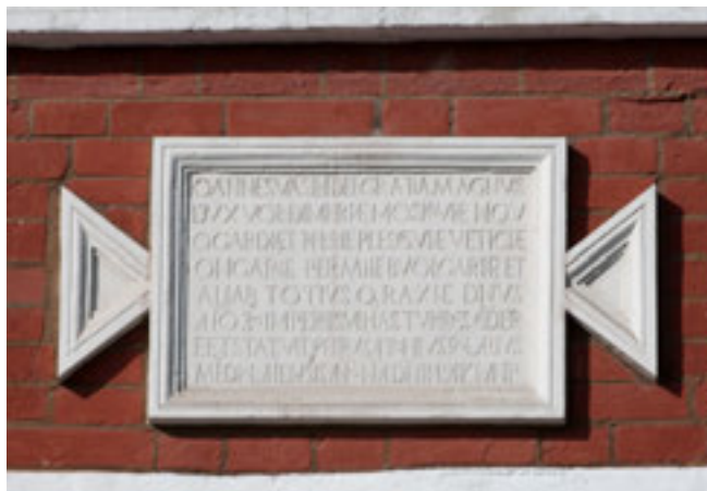
Рис. 2. Мемориальная доска — белокаменная плита над проездными воротами Спасской (Фроловской) башни Кремля

выполняли функцию обозначения уровня воды при наводнениях (рис. 3). Позже на стенах Казанского собора увековечили имя А. П. Воронихина, а в конце мая 1880 г. по адресу ул. Мойка, 12 была установлена доска в память о Пушкине (рис. 4). В июне 1890 г. на собрании Городской думы было принято решение о начале повсеместной установки и других памятных досок на строениях, возведенных после введения в Петербурге Городового положения 1870 г. 4 Особого внимания удостоились павильоны Сенного рынка, здания городской скотобойни, Петровской пожарной части и пожарного депо. В конце XIX — начале XX века в Москве было установлено несколько мемориальных досок, посвященных известным людям. Три из них сохранились и поныне на домах, где жили А. В. Суворов (Большая Никитская, 42), А. Н. Скрябин (Большой Николопесковский переулок, 11), а также на доме, где родился Н. И. Пирогов (Мельницкий переулок, 12).