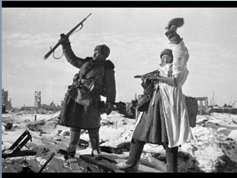
Центр города Сталинграда, 2 февраля 1943 года.