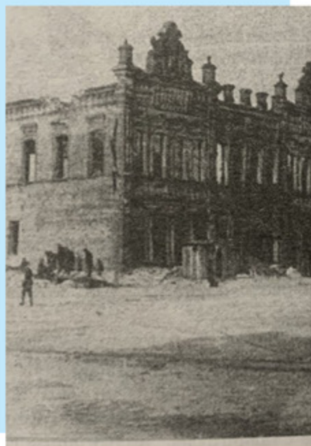
Разрушенное здание, где будет открыт Сталинградский институт городского хозяйства (1943г.)