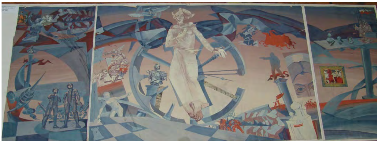
Денисов Д. В. Эскизный проект росписи для интерьера музея Революции