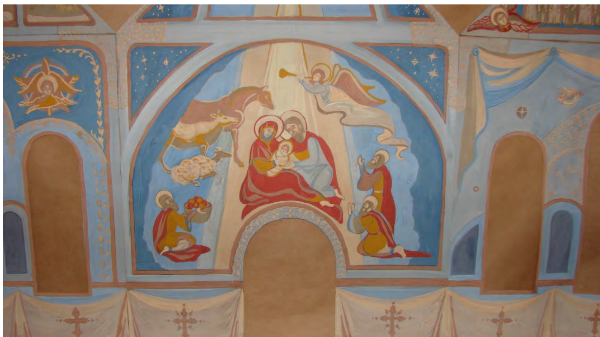
Лильчук К. «Рождество Христово». Эскизный проект росписи одной из стен часовни в Дубовке