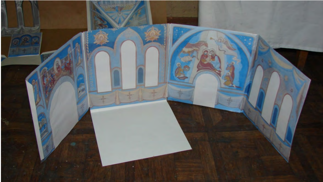
Лильчук К. Эскизный проект росписи часовни в макете