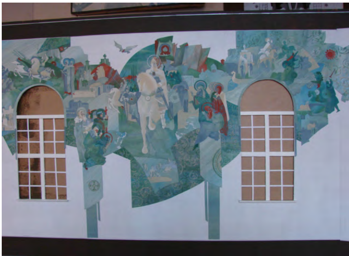
Потлов Д. Эскизный проект росписи интерьера часовни Дмитрия Донского