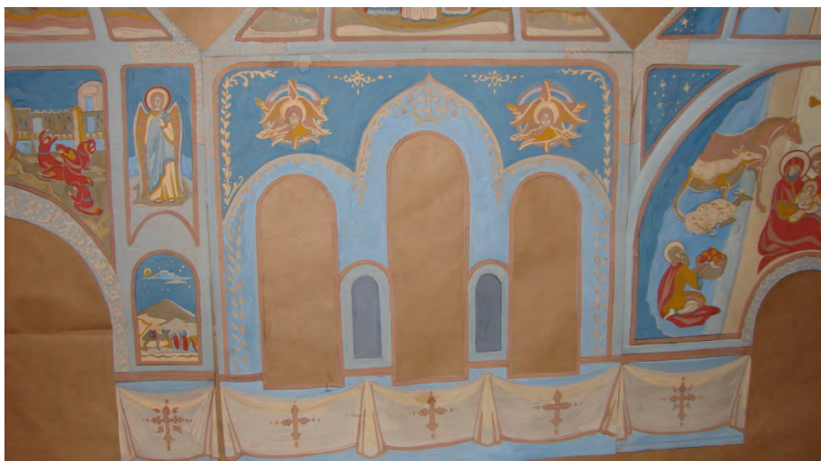
Фрагменты эскизного проекта