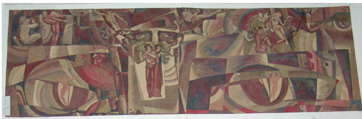
Медведева Н. Эскизный проект для интерьера музея Этнографии