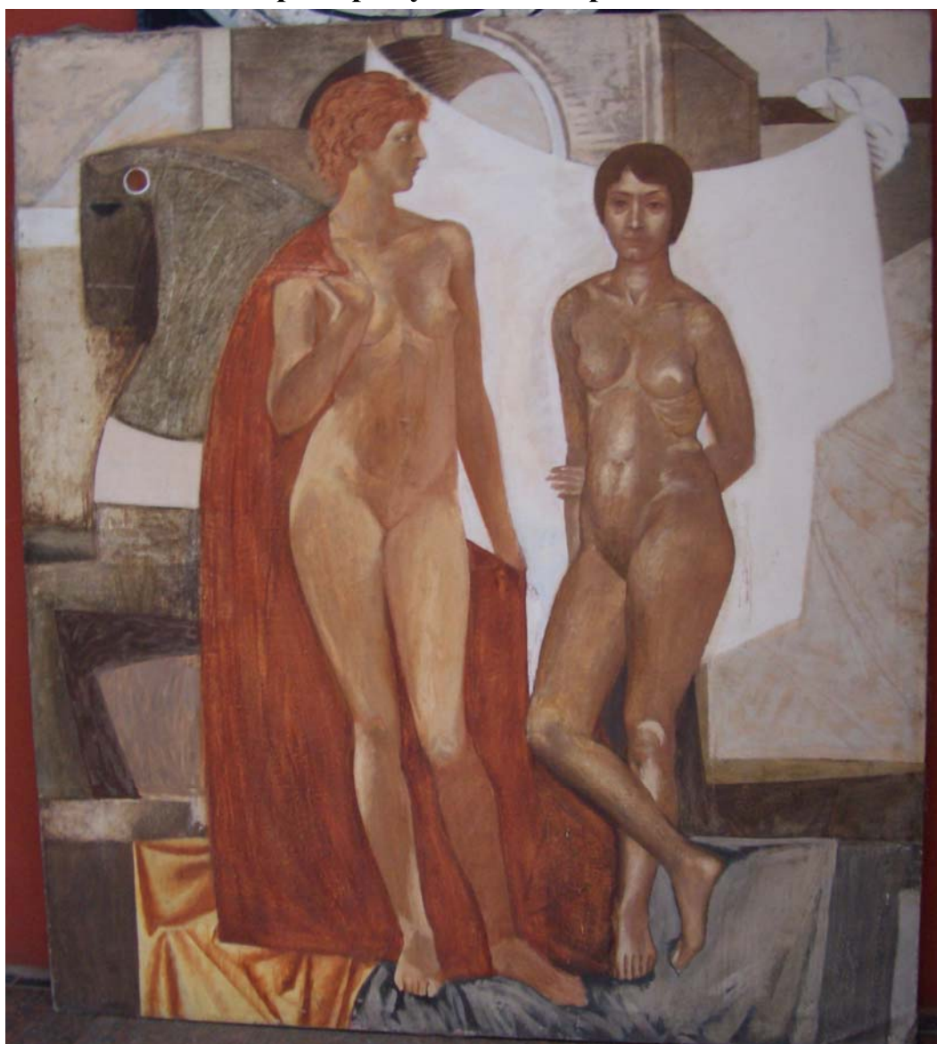
Работа студента 5-го курса МДИ