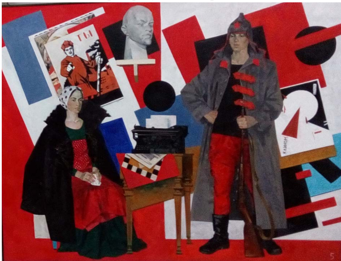
Работа студента 5-го курса МДИ