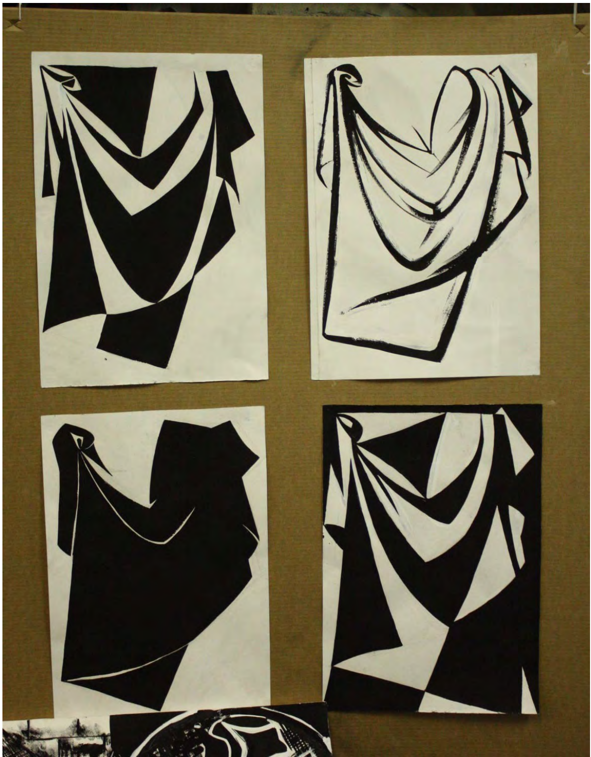
Силуэт, раскладка, линия . Студенческая работа.