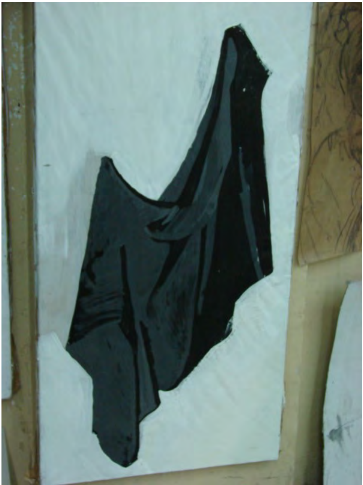
Силуэтное решение драпировки. Студенческая работа.