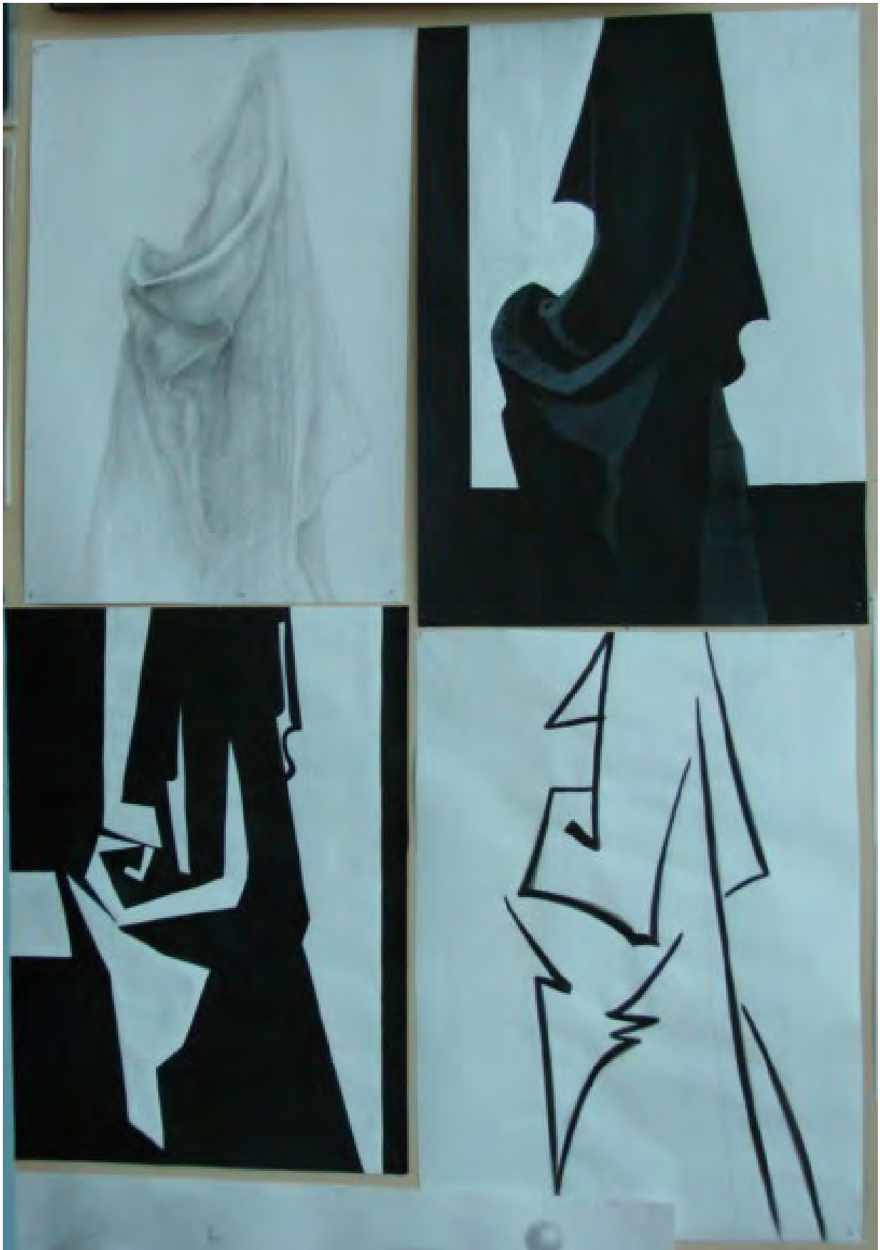
Аналитический рисунок, силуэтное решение, раскладка, линейное решение. Студенческая работа