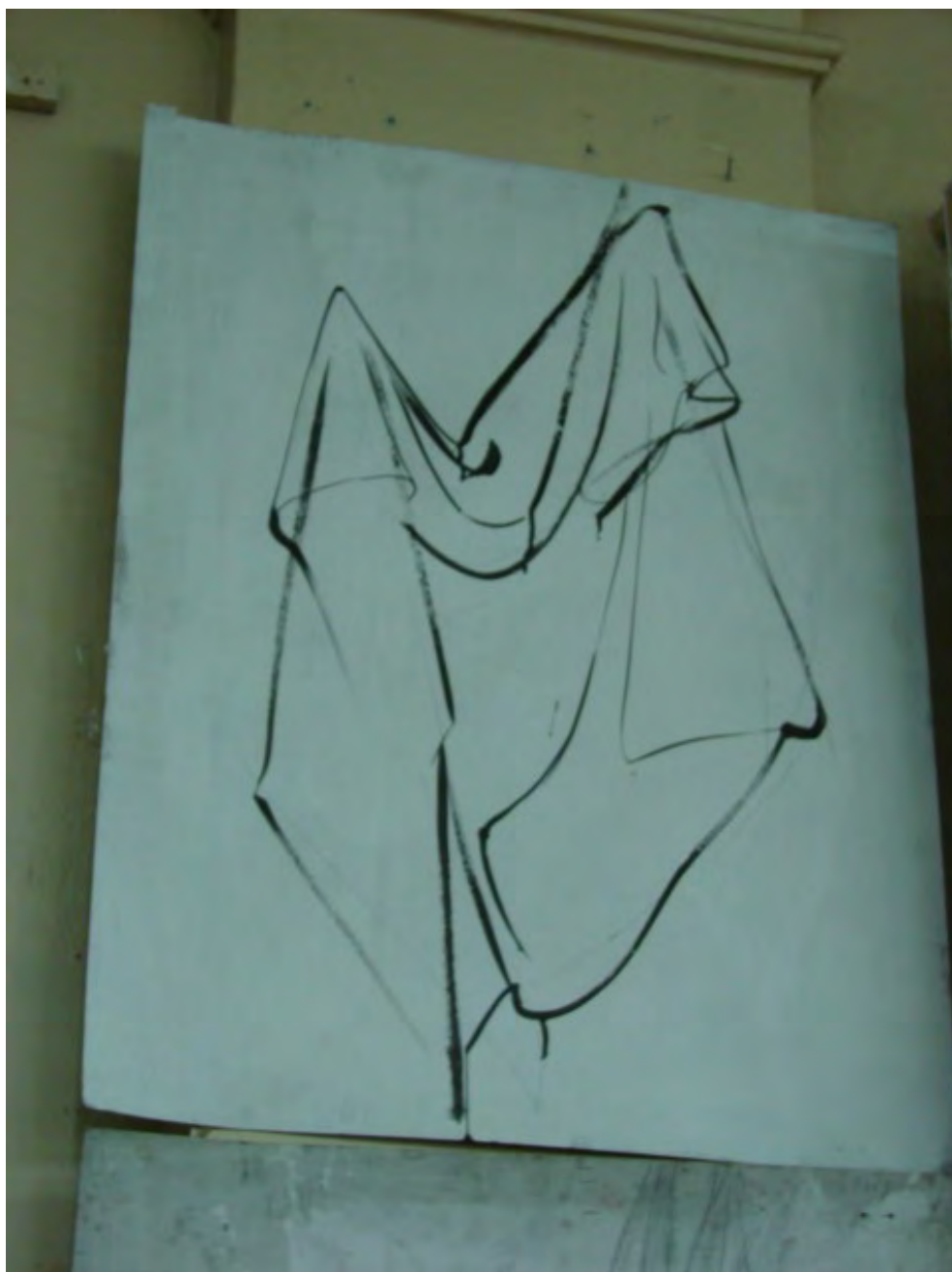
Линейный рисунок драпировки. Студенческая работа.

Оценка «неудовлетворительно» ставится либо в случае отсутствия работы, либо за работу, выполненную в объеме менее 60%, не соответствующую сформулированным целям и задачам при отсутствии художественно-эстетического видения.