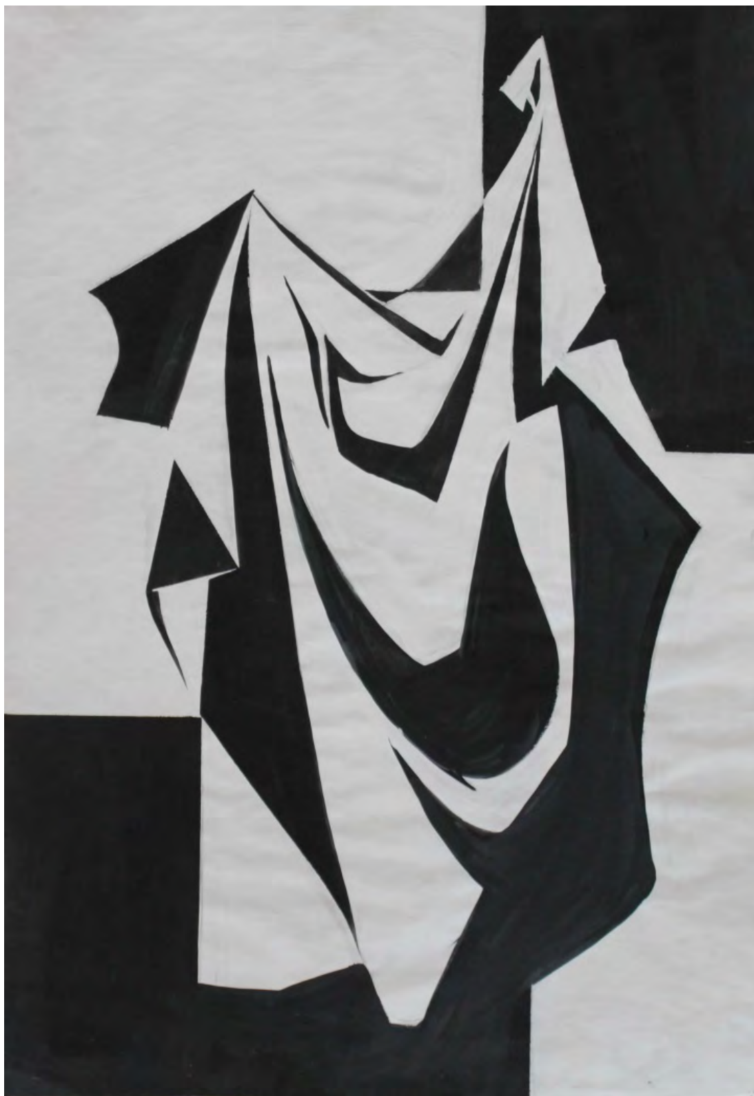
Графическая переработка аналитического рисунка драпировки в два тона методом раскладки. Студенческая работа.

Оценка «неудовлетворительно» ставится либо в случае отсутствия работы, либо за работу, выполненную в объеме менее 60%, не соответствующую сформулированным целям и задачам при отсутствии художественно-эстетического видения.