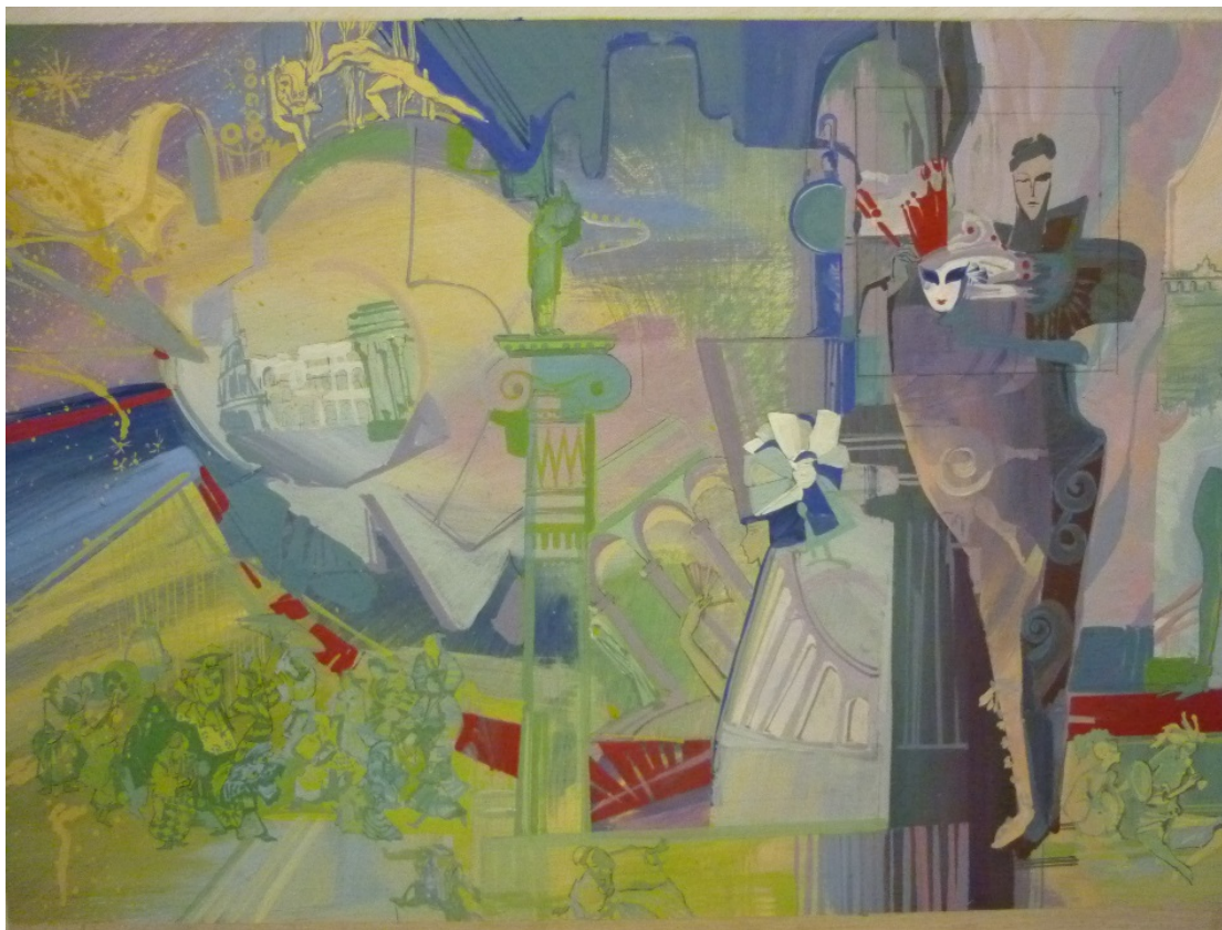
Работа студента 6-го курса МДИ