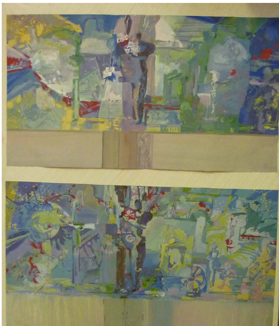
Работа студента 6-го курса МДИ