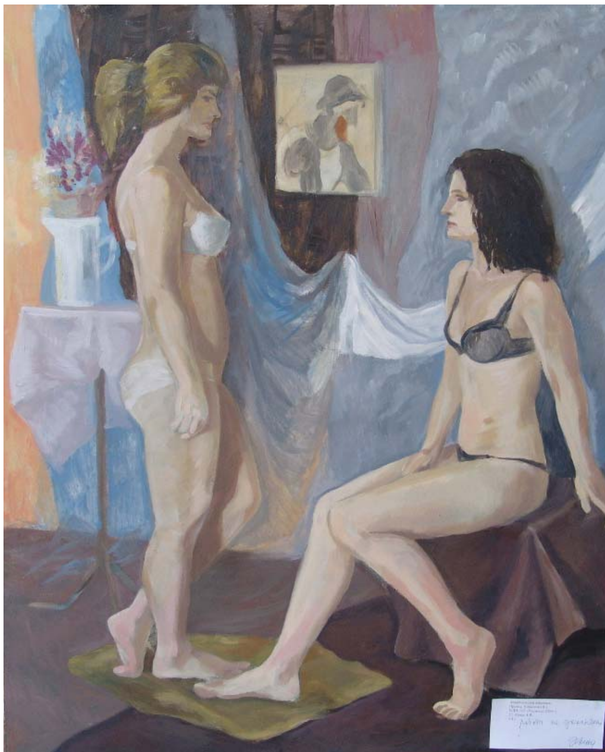
Работа студента 5-го курса МДИ