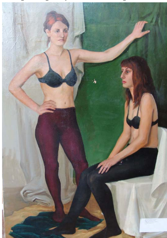
Работа студента 5-го курса МДИ