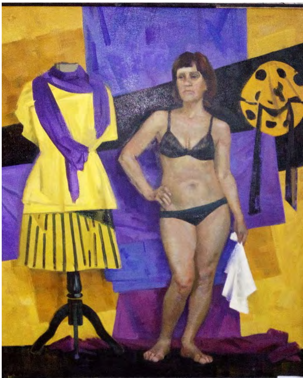
Работа студента 3-го курса МДИ