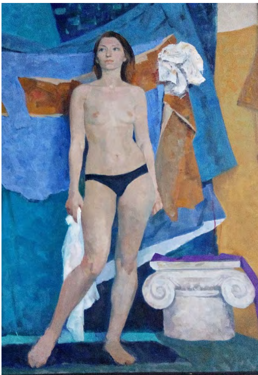
Работа студента 3-го курса МДИ