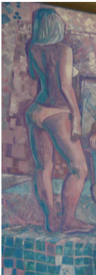
Работа студента 3-го курса МДИ