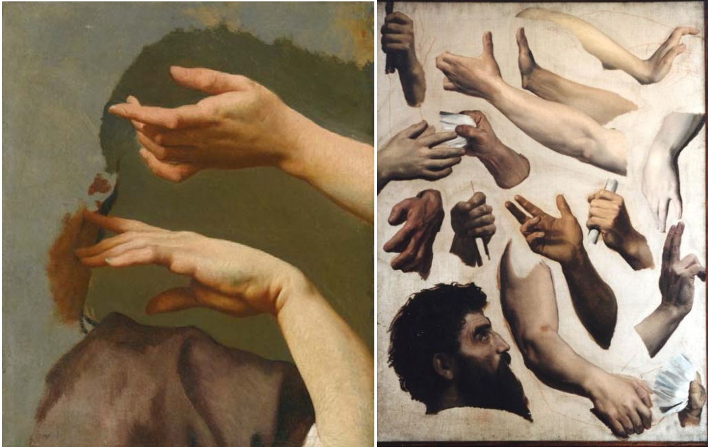
Метод тоновой подкладки с последующей лессировкой