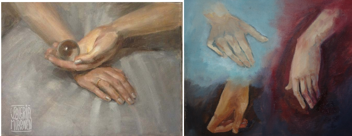
Метод живописной моделировки без использования тоновой подготовки