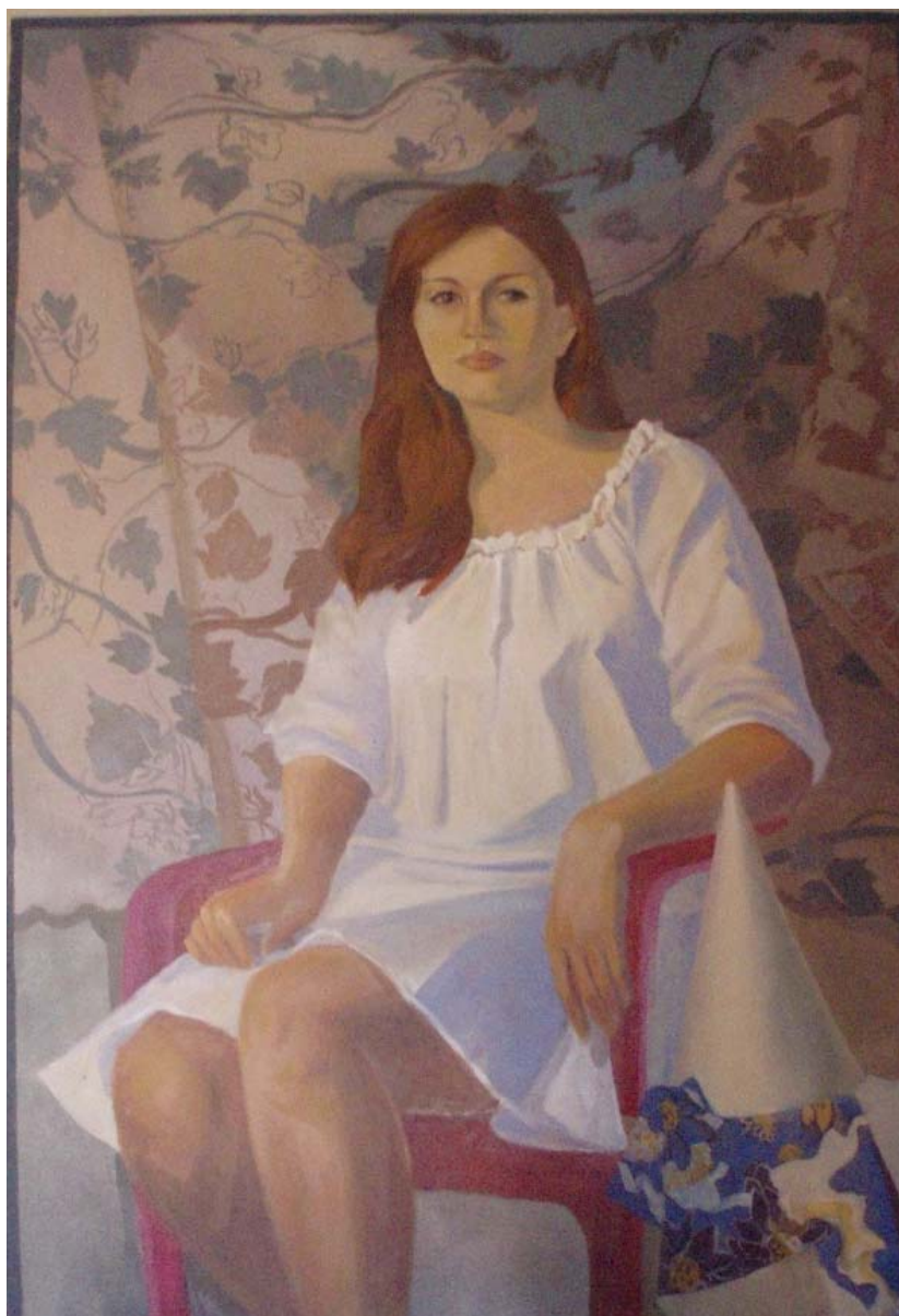
Работа студентов 2-го курса МДИ