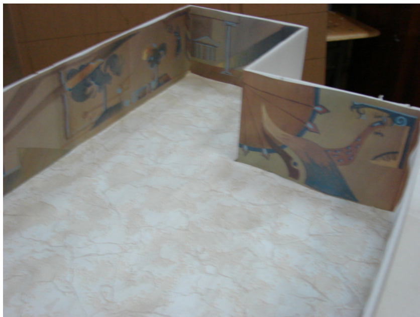
Фрагменты интерьера столовой. Сохранение и зрительное разрушение стен