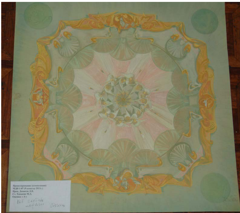
Чадаева У. Эскизный проект росписи плафона в плоскостной изобразительной системе