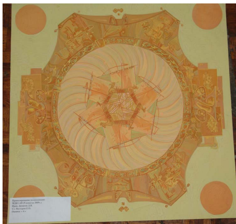
Иванова М. Решение композиции в гамма-сближенном колорите. Малоуглубленная система