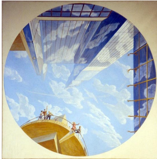
Мазур С. Эскизный проект пространственного плафона для интерьера актового зала строительного техникума. Студенческая работа