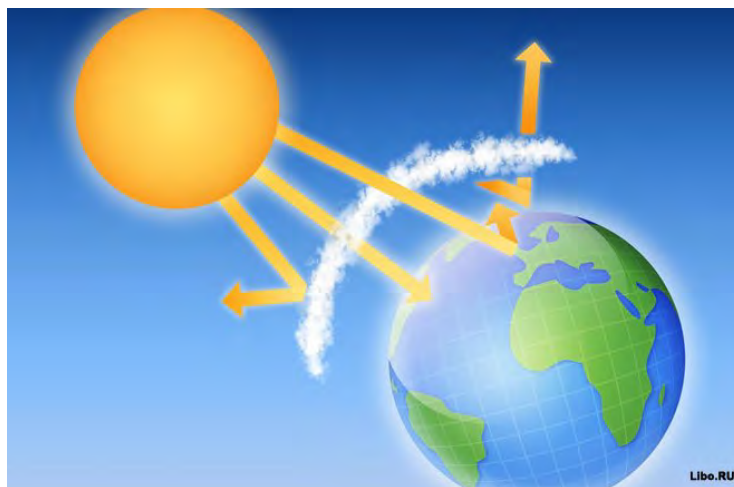
Рис. 9. Парниковый эффект

препятствуют длинноволновому тепловому излучению с земной поверхности. Часть этого поглощенного теплового излучения атмосферы возвращается обратно к земной поверхности (рис. 9).