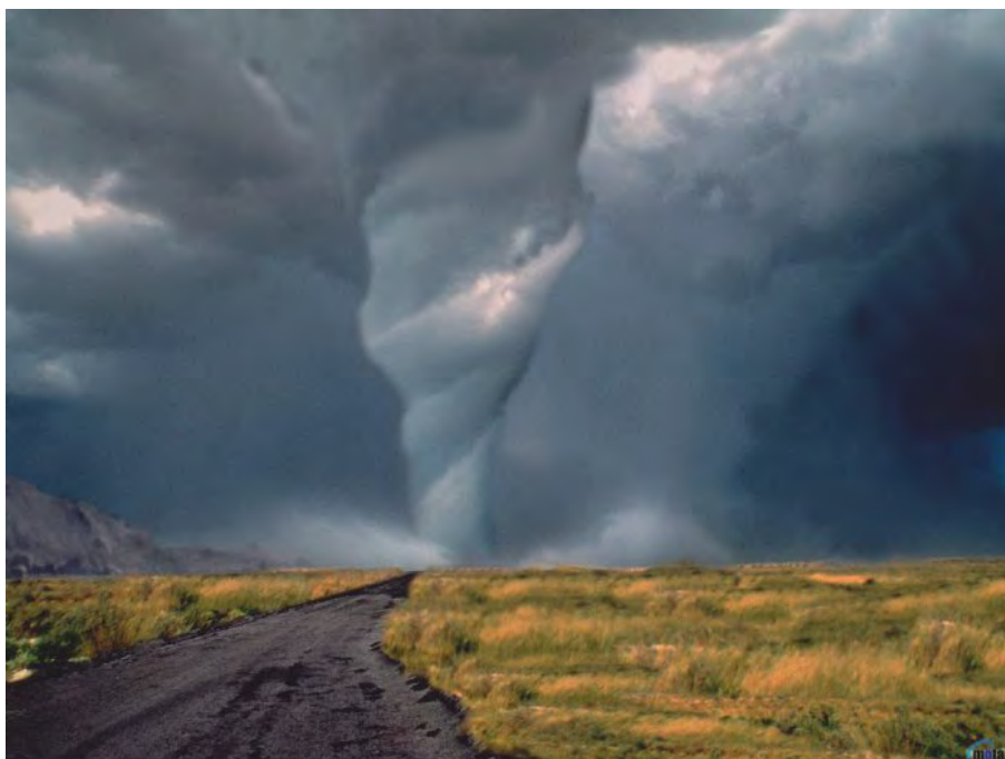
Рис. 19. Смерч

Смерч (торнадо) — вихревое движение воздуха, распространяющегося в виде гигантского черного столба диаметром до сотен метров, внутри которого наблюдается разрежение воздуха, и затягивающего различные предметы (рис. 19).