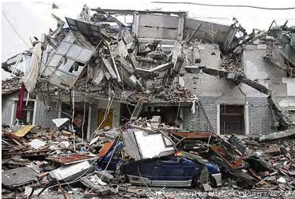
Рис. 13. Разрушение здания в результате землетрясения

Количество санитарных (временных) и безвозвратных потерь зависит от ряда факторов: