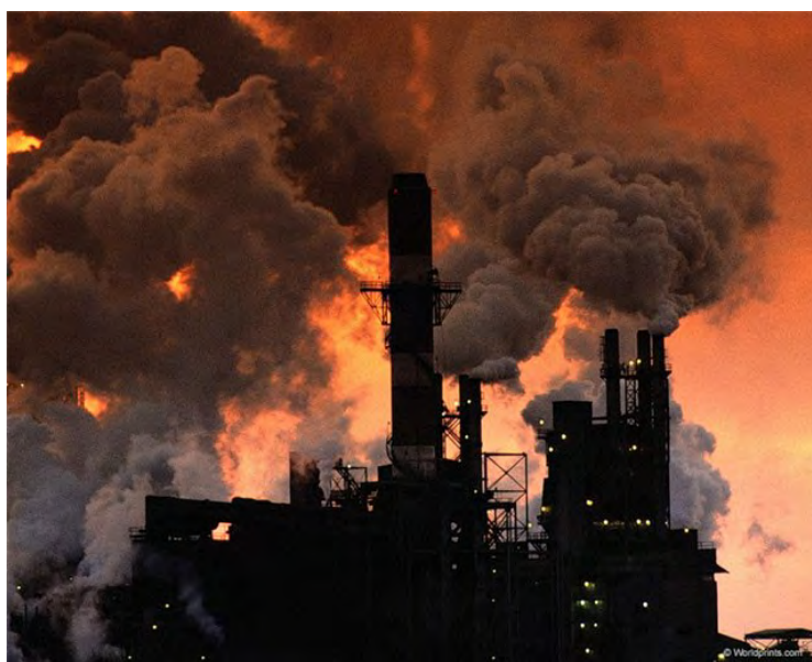
Рис. 7. Загрязнение атмосферы промышленным предприятием

Однако в последние десятилетия антропогенные загрязнения и воздействия на атмосферу стали преобладать над естественными как по частоте, так и по характеру, а главное, по масштабу проявления, постепенно приобретая глобальное значение. К основным источникам загрязнения относят промышленные предприятия, транспорт, теплоэнергетику, сельское хозяйство и др. Среди отраслей промышленности особо токсичные выбросы в атмосферу дают предприятия химической, нефтеперерабатывающей, черной и цветной металлургии, деревообрабатывающей, целлюлозно-бумажной отраслей, производства строительных материалов и др. (рис. 7).