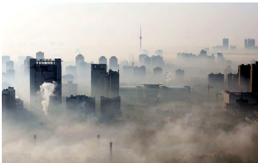
Рис. 8. Смог в современном мегаполисе

По своему физиологическому воздействию на человеческий организм фотохимический смог крайне опасен, особенно для дыхательной и кровеносной систем: возникает стойкая неспособность крови к усвоению и переносу кислорода.