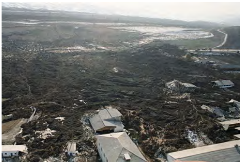
Рис. 16. Последствие схода селевого потока

Обладая большой массой и высокой скоростью передвижения (до 15 км/ч), сели разрушают здания, дороги, гидротехнические и другие сооружения, выводят из строя линии связи и электропередачи, уничтожают сады, заливают пахотные земли, приводят к гибели людей и животных. Все это продолжается 1...3 ч. Время от возникновения селя в горах до момента выхода его в предгорье часто исчисляется 20...30 мин.