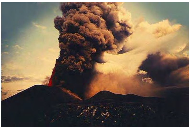
Рис. 6. Выброс вулканических веществ в атмосферу

Значительное загрязнение атмосферы природного происхождения вызывается пыльными бурями, образование которых связано с переносом сильным ветром поднятого с земной поверхности большого количества пыли или песка, частиц верхнего слоя пересушенной почвы, не закрепленных корневой системой растений.