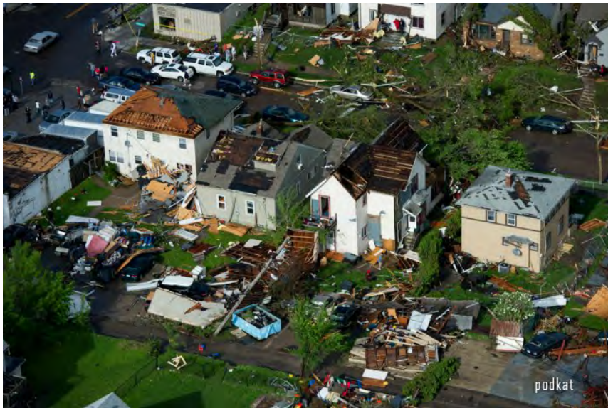
Рис. 20. Последствия смерча

Деятельность органов власти и управления, направленная на предупреждение и смягчение последствий ураганов, смерчей и бурь, включает: