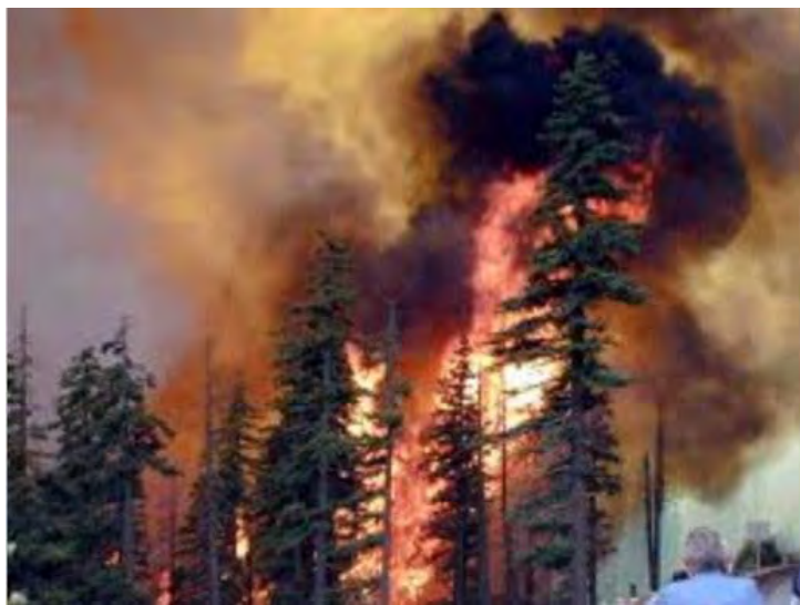
Рис. 11. Лесной пожар

дыма, росы или дождя на листья вызывает болезнь и гибель растений. Выделения большого количества дыма при крупных пожарах уменьшает количество солнечной радиации, поступающей с земной поверхности и, как следствие, приводит к климатическим изменениям продолжительностью в несколько дней, недель, месяцев. Эти факторы влияют на рост растений, особенно если совпадают с вегетационным периодом.