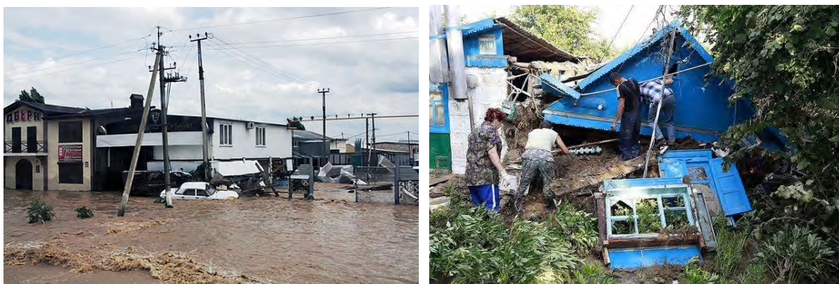
Рис. 24. Последствия наводнения

3. Вызванные подводными землетрясениями. Они характеризуются появлением гигантских волн большой длины — цунами. Скорость распространения цунами может достигать 1000 км/ч. Высота волны в области ее возникновения не превышает 5 м. Но при приближении к берегу крутизна цунами резко растет, и волны с огромной силой обрушиваются на побережье. У плоских побережий высота волны не превышает 6 м, а в узких бухтах достигает 50 м (туннельный эффект). Продолжительность действия цунами до 3 ч, а поражаемая ими береговая линия достигает длины 1000 км.