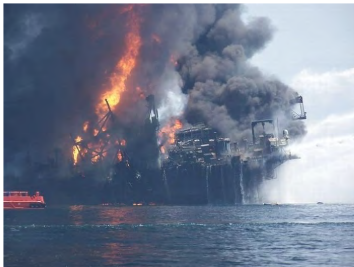
Рис. 12. Пожар на нефтяной вышке

Наиболее опасные ситуации, связанные с воздействием на окружающую среду, возникают на пожарах при разлиии ЛВЖ и ГЖ на нефтебазах (в резервуарах, обваловании и за его пределами) (рис. 12), транспортных средствах (при морских перевозках), на химических предприятиях, радиационных объектах, складах удобрений, пестицидов, аварийно химически опасных веществ (АХОВ).