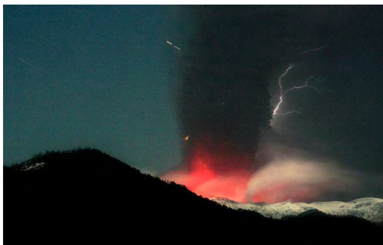
Рис. 14. Извержение вулкана

Извержение вулкана — процесс выброса вулканом на земную поверхность раскаленных обломков, пепла, излияние магмы, которая, найдя выход на поверхность, становится лавой (рис. 14).