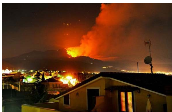
Рис. 15. Последствия извержения вулканов

Наиболее частыми причинами гибели людей и животных в районах извержения вулканов являются травмы, ожоги (часто верхних дыхательных путей), асфиксия (кислородное голодание), поражение глаз. В течение значительного промежутка времени после извержения вулкана среди населения наблюдается повышение заболеваемости бронхиальной астмой, бронхитами, обострение ряда хронических заболеваний. В районах извержения вулканов устанавливается эпидемиологический надзор.