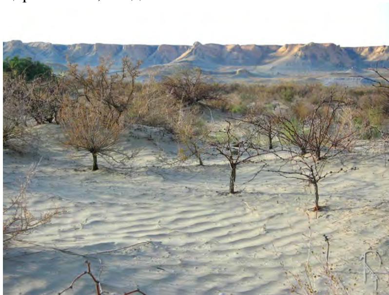
Рис. 5. Ветровая эрозия

и стимулируют эмиссию газообразных углеводородов в атмосферу. Весьма распространенным является нефтехимическое загрязнение почв на автозаправочных станциях, базах горюче-смазочных материалов, при транспортировке и особенно при авариях с разливом нефтепродуктов. Загрязнение почв нефтью и нефтепродуктами ухудшает их физические свойства, ингибирует биологическую активность, обуславливает накопление в почве токсичных, в том числе канцерогенных, соединений.