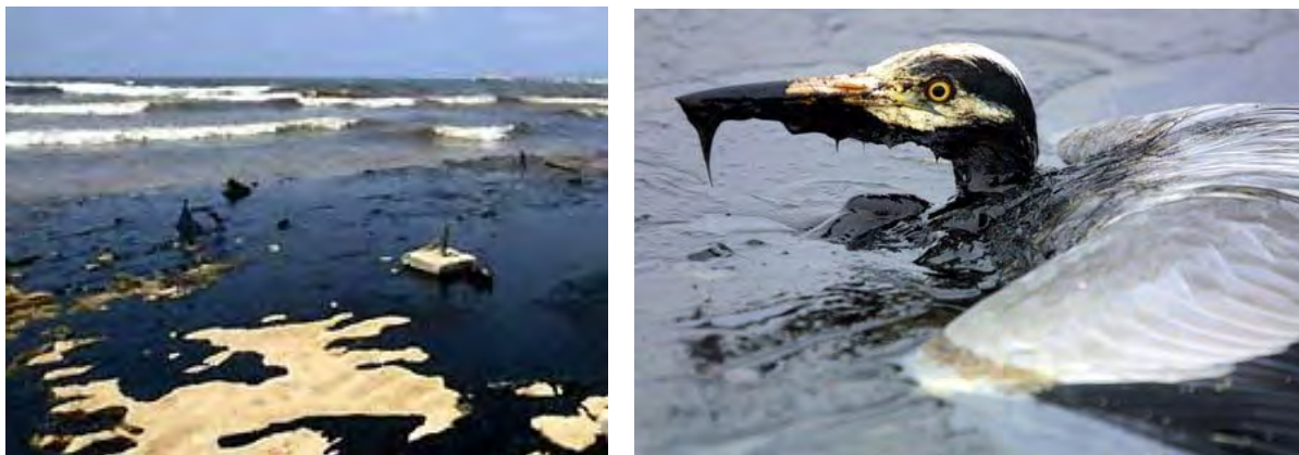
Рис. 2. Нефтяное загрязнение и его последствия

процессы в океане, что приводит к весьма нежелательным последствиям глобального масштаба, а на более низких уровнях отрицательно влияет на функционирование гидробиоценозов.