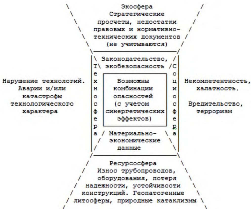
Рис. 1. Группы фактических опасностей для окружающей среды

Антропогенные воздействия на окружающую среду достаточно разнообразны. К ним относятся: