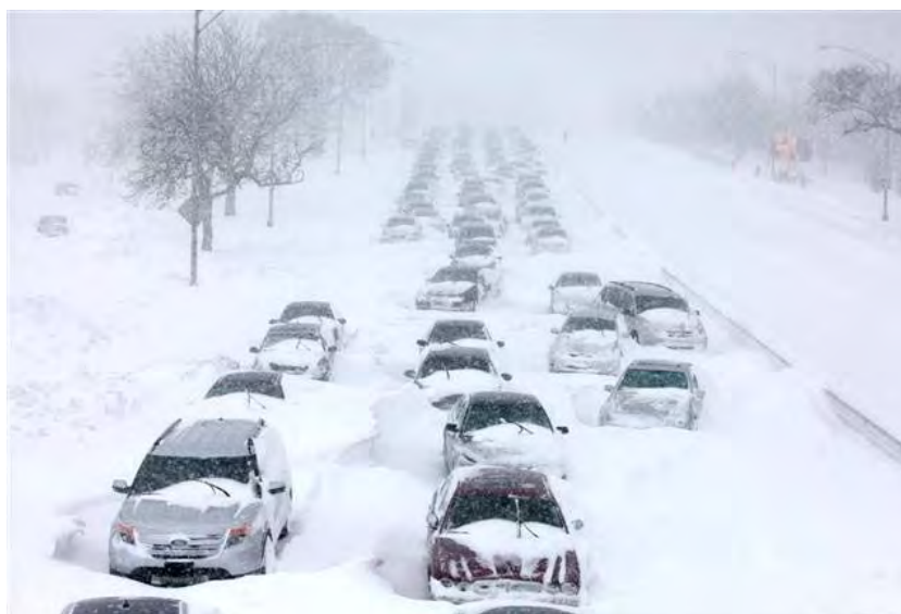
Рис. 21. Снежный занос на городской магистрали

Снегопады могут продолжаться до нескольких суток, заноса дороги (рис. 21), населенные пункты, приводя к жертвам и прекращению снабжения.