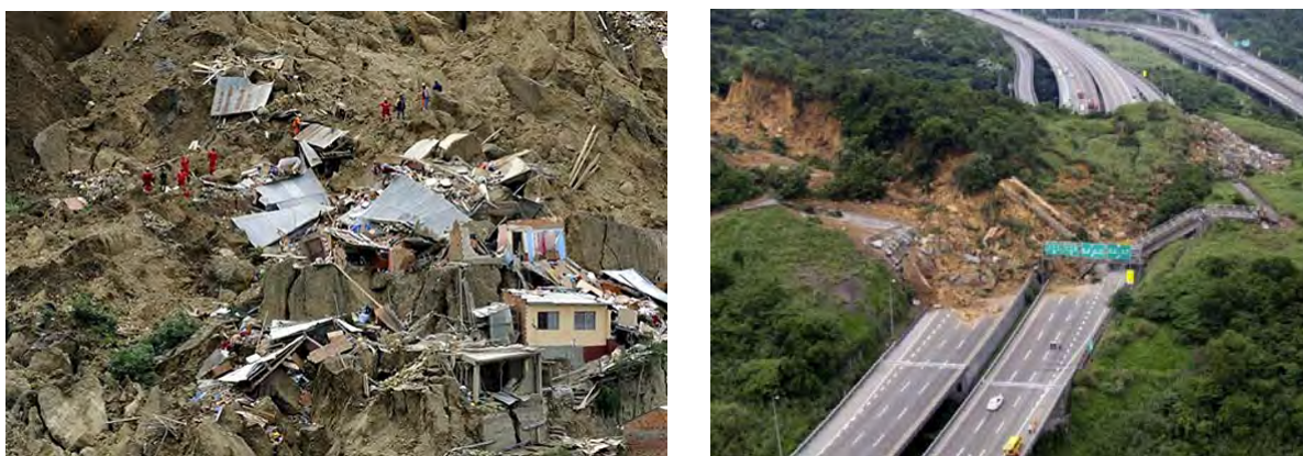
Рис. 17. Последствия схода оползней

Основными причинами возникновения оползней являются избыточное насыщение подземными водами глинистых пород до текучего состояния, воздействие сейсмических толчков, неразумная хозяйственная деятельность без учета местных геологических условий. Согласно международной статистике, до 80 % оползней в настоящее время связано с деятельностью человека. При этом по склону сползают огромные массы грунта вместе с постройками, деревьями и всем, что находится на поверхности земли (рис. 17).