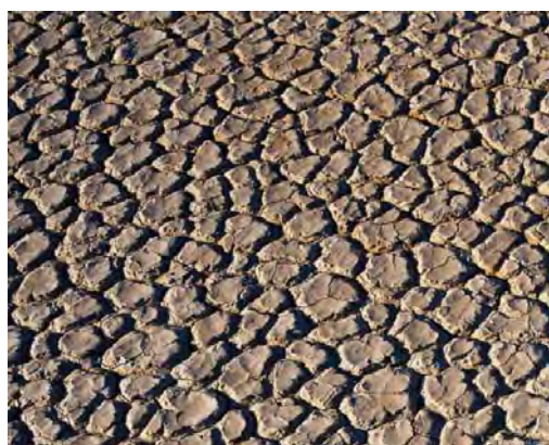
Рис. 4. Деградация почв

Экологические функции почвы весьма изменчивы, а в целом они обладают высокой степенью динамичности свойств и состава, что делает эту важнейшую для биосферных процессов субстанцию чрезвычайно чувствительной к влиянию хозяйственной деятельности человека. Изменения могут быть как позитивными, так и негативными, вплоть до полной утраты тех или иных функций при деградации почв или полного ее уничтожения.