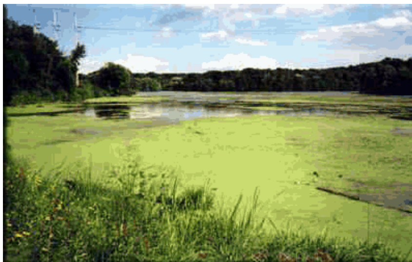
Рис. 3. Эвтрофикация

Эстетическое загрязнение , как правило, связано с преднамеренным или случайным изменением визуальных доминант природных или антропогенных ландшафтов в результате человеческой деятельности.