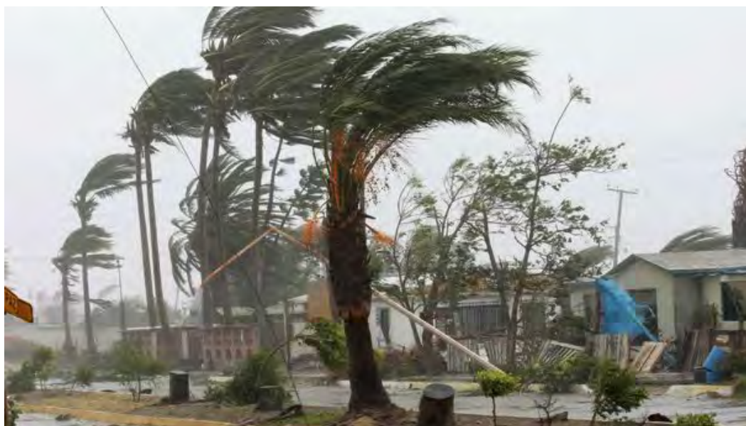
Рис. 18. Ураган

Ураган способен пройти путь в сотни километров. Он опустошает все на своем пути: ломает деревья, разрушает строения, создает на побережье волны высотой до 30 м, может быть причиной ливней, а позднее обусловить появление эпидемии (рис. 18). Ураганы (циклоны, тайфуны) имеют сезонную динамику.