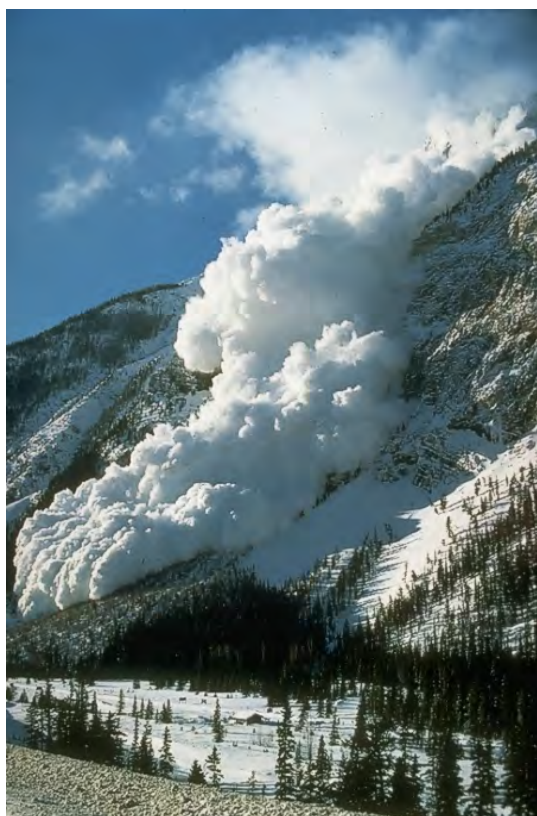
Рис. 22. Сход лавины

Движущаяся масса сметает все на своем пути, что приводит к жертвам, обрывам ЛЭП, разрушениям коммуникаций. Зафиксированы случаи, когда просуществовавшие сотни лет селения были погребены под лавинами (в Швейцарии, на Кавказе). Объем лавины может достигать 2,5 млн м 3 , а скорость — до 100 м/с при давлении в момент удара 60...100 т/м 2 (сухая лавина) или до 20 м/с при давлении в момент удара до 200 т/м 2 (лавина из плотного мокрого снега).