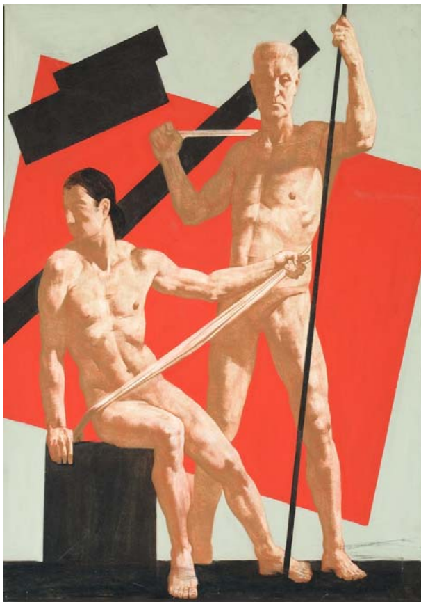
Работа студента 5 курса

Методическая последовательность выполнения работ: