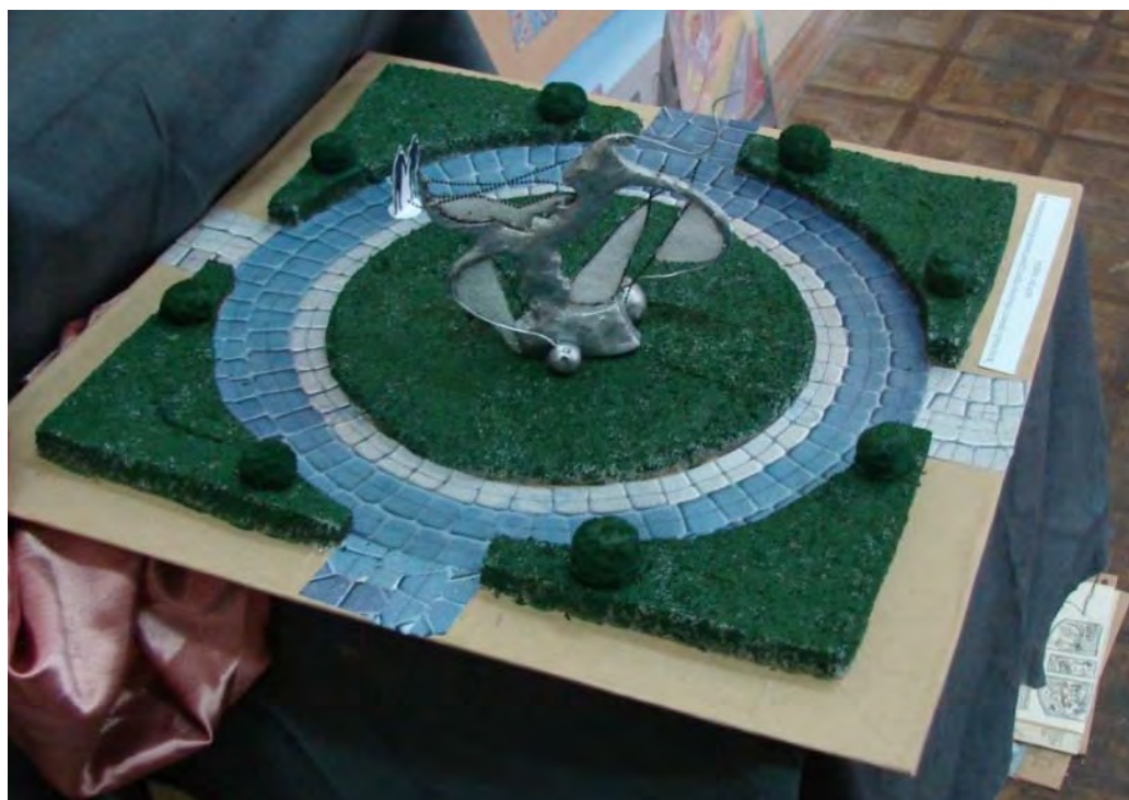
Лильчук К. Макет ландшафтного дизайна части парка