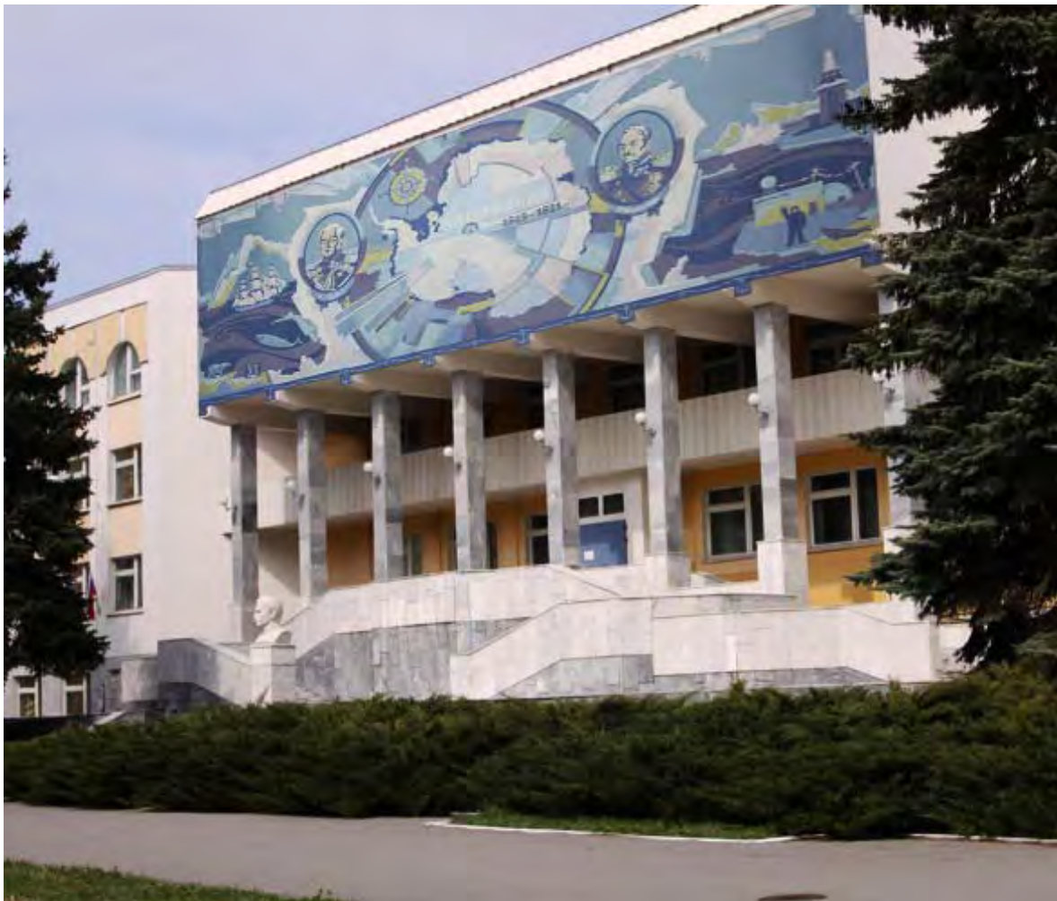
Визуализация эскиза мозаичного панно