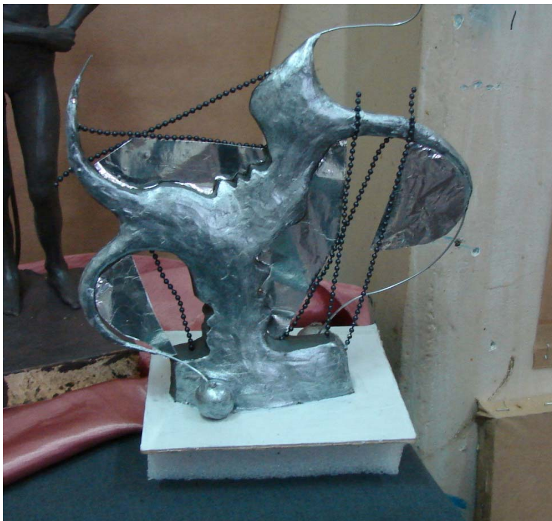
Лильчук К. Макет объемно-пространственной композиции.