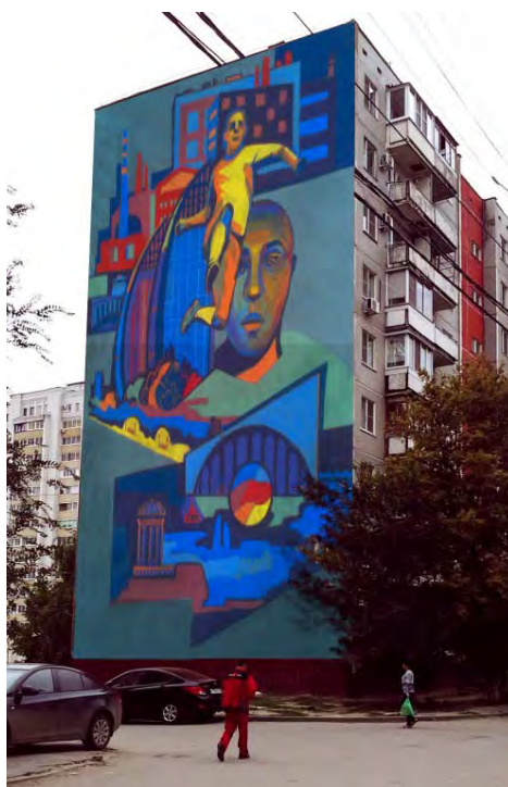
Визуализация эскизного проекта