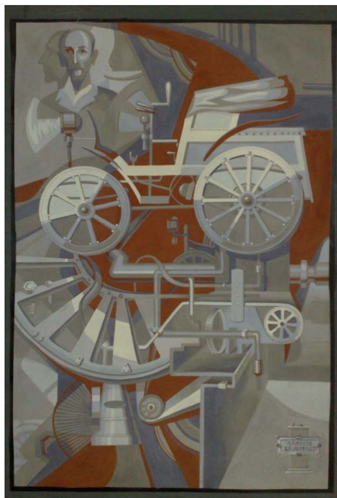
Зубцова Э. Эскизный проект сграфитто для экстерьера административного здания автомобильного завода