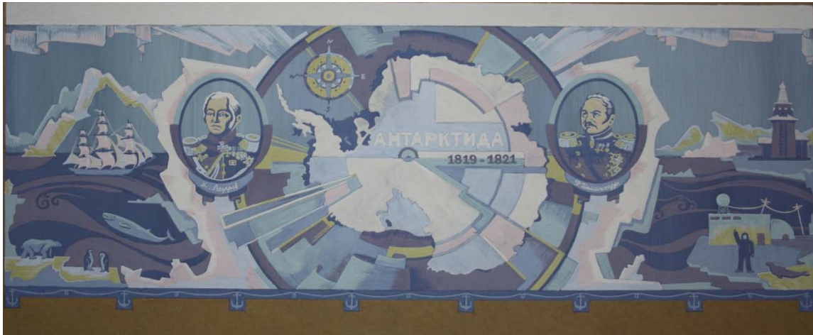
Эскизный проект мозаичного панно на фасаде здания Географического общества