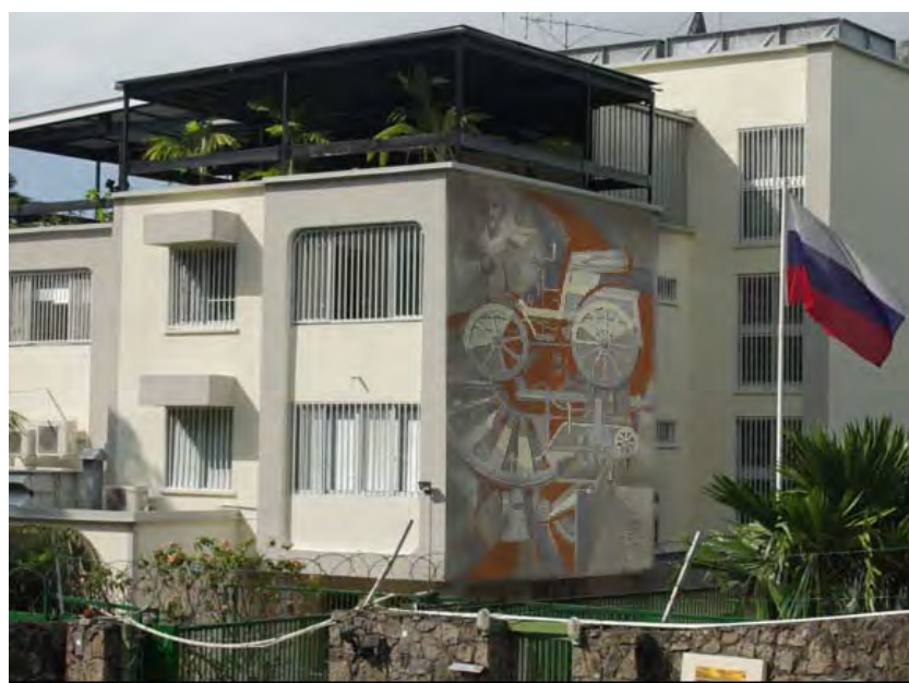
Визуализация эскизного проекта панно в технике сграфитто