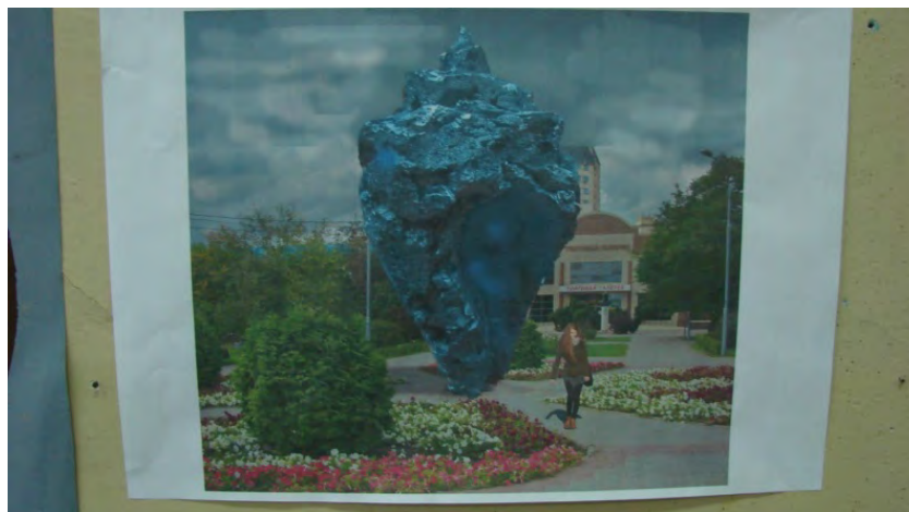
Бобровская А. Визуализация макета в перспективе